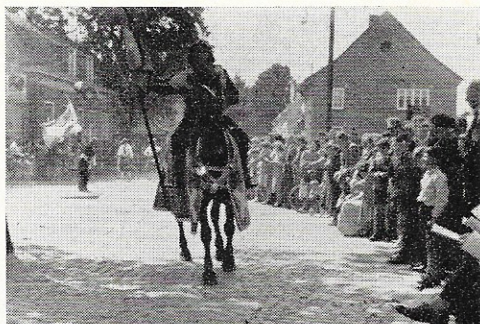
De fiere standaardrijder van O. L. Vrouw Schuts te Elshout.