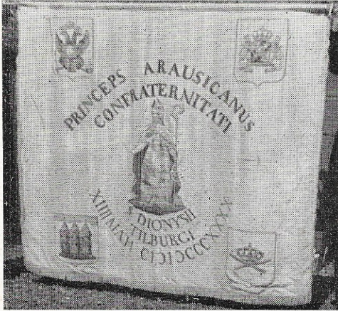
Vaan St. Dionysius 1e prijs schoonste gildevaan

Mooist gecostumeerde Gilde: St. Barbara te Oisterwijk. Beste niet-gecostumeerde Gilde: St. Lambertus te Vessem. Oudste Gilde-vaan: O. L. Vrouw Broederschap te Oirschot. Mooiste Gilde-vaan: St. Dionisius te Tilburg. Oudste standaard: St. Sebastiaan te Lage-Mierde. Mooiste standaard: St. Dionisius te Tilburg. Mooiste verzameling Konings zilver: St. Dionisius te Tilburg. Mooiste papegaai: St. Willi-