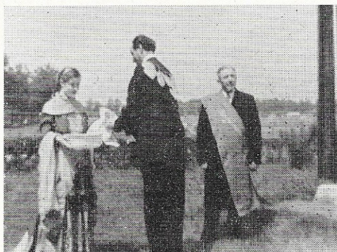
De nieuwe Koning wast zijn handen onder de schutsboom — St. Barbara reikt het bekken daartoe aan — Hoofdman Kosters rechts bij de boom.

de burgerlijke autoriteiten, hetgeen geschiedde op het grasveld bij de kiosk op de Lind. In zijn toespraak wees Oisterwijks burgemeester er op, dat gilde St. Barbara na de ruïneuze brand weer glorievol was herrezen en nu als