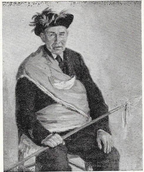
Foto van schilderij door Reinier Pijnenburg voorstellende de hoofdman Roozen van „St. Joris”, Moergestel

Hoe werkt nu de Federatie, zal men vragen? Dit is zeer eenvoudig. Op de voorgrond staat, dat de Gilden lid zijn en niet de kringen. Ten behoeve echter van hun huiselijke en streekbelangen zijn de