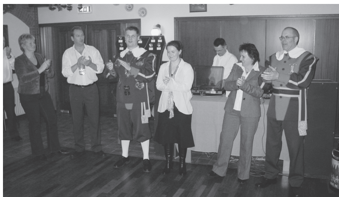
Huldiging van de jubilarissen