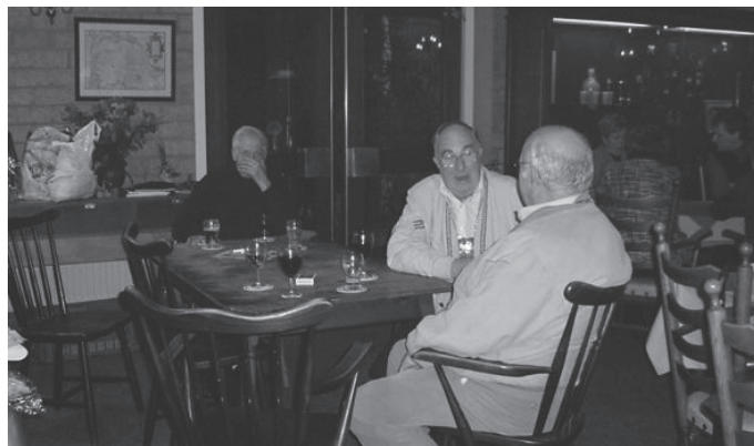
Naamdag van het Geldropse gilde