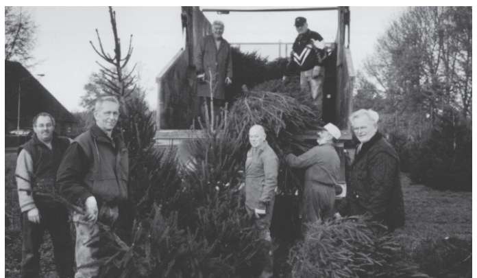
De kerstbomen worden opgeladen