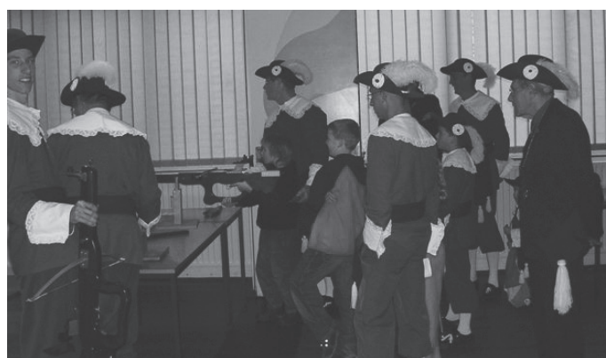
De jeugd werd goed gestimuleerd

tentoonstelling opgezet van gildenattributen. In de aanloop naar deze open dag hebben de leerlingen van basisschool Onze Bouwsteen kleurplaten ingekleurd en opstellen gemaakt naar aanleiding van een dvd over het gildewezen in Noord-Brabant. De prachtige kleurplaten en de mooie opstellen werden tentoongesteld. Hieraan waren enkele prijzen gekoppeld. Aan het einde van de dag dankte de voorzitter iedereen voor zijn aanwezigheid en belangstelling en de gildeleden voor hun inzet en reikte de prijzen uit. Ook een speciaal woord van dank aan de kinderen van de groepen vijf, zes, zeven en acht voor hun inzet, aan de leiding van deze groepen en ook aan de schoolleiding van de basisschool Onze Bouwsteen. Na deze open dag hebben we nog diverse reacties ontvangen met vragen over de onderdelen van het gilde en tot nu toe enkele aanmeldingen binnengekregen om opgeleid te worden tot tamboer, vendelier of kruisboogschutter. De doelstelling om de jeugd te bereiken kan geslaagd genoemd worden gezien de vele reacties van de jeugd en hun ouders.