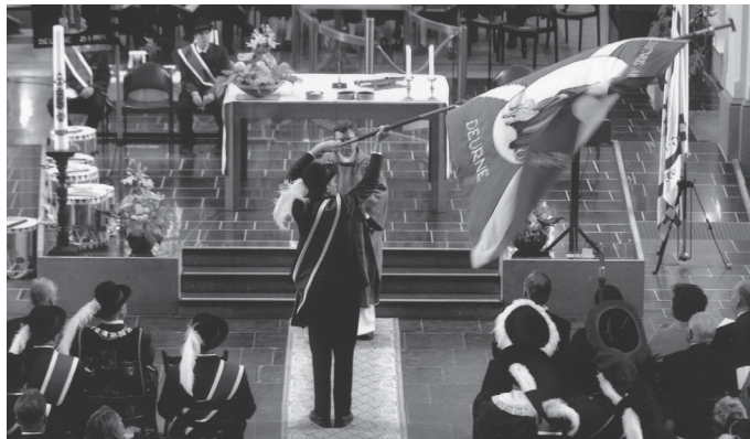
De eed van trouw aan het kerkelijke gezag

Jan is nog altijd zeer betrokken bij het gilde. Hij bezoekt steevast alle overheidsvergaderingen. Hij luistert en zegt weinig, maar dat wil niet zeggen dat zijn aandacht er niet bij is. Indien er belangrijke punten aan de orde zijn of er dreigen beslissingen genomen te worden waar hij het niet mee eens is, dan roert hij zijn mondje en tracht hij de overheid van zijn gelijk te overtuigen. Maar altijd zal de gemoedelijkheid de boventoon voeren. Bij vele bijeenkomsten in het gildehuis nam Jan aan de piano plaats en voerde de gildebroeders en -zusters mee over Neêrlands polders en dijken, speelde hij muziekjes over liefde en weemoed; maar ook een heuse boogie-woogie tovert hij nog altijd virtuoos uit de witte en zwarte toetsen. Kortom, Jan Smets is een gildebroeder om trots op te zijn.