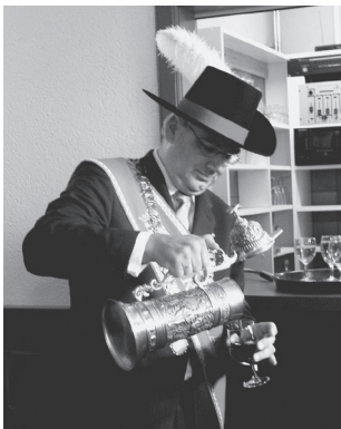
Eerwijn uit de geschonken sierkan

Met de klank van bazuinen en gezwaai van vendels werd Lexmond en Hei- en Boeicop op zaterdag 20 augustus 2005 duidelijk gemaakt dat het weer een gilde binnen de grenzen heeft. Het Sint Martinus- en Sint Antoniusgilde werd op deze dag officieel herinstalleerd tijdens een bijeenkomst in de Hervormde Kerk in Lexmond. 's Middags stond er een tocht door de straten van Lexmond en een presentatie op het sportcomplex Het Bosch met aansluitend demonstraties