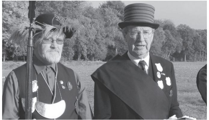
Prijsuitreiking Gemeentewisselschild Vught

daarom de prijs uit met een toepasselijk woord aan het Sint Catharinagilde.