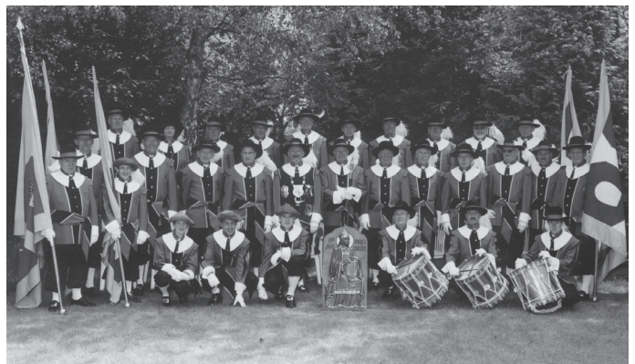
Het gilde in nieuw tenue, mei 2005

Na vijftien jaar intensief gebruik waren de tenues van ons gilde volledig aan vervanging toe. Vooral de zwarte jassen die we noodgedwongen in koudere periodes droegen waren niet al te best van kwaliteit, kwamen flodderig over en ook de pasvorm liet veel te wensen over.