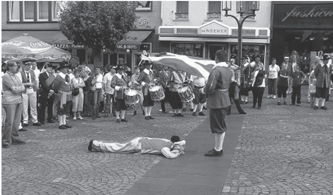
Vendelgroet in Mayen

optocht waren wij aangewezen om ons op eigen initiatief te vermaken. Om het publiek te amuseren maakten onze tamboers, vendeliers en de ander leden van ons gilde een kring en brachten aan de bevolking een vendelgroet. Er was een nar van een Gelders gilde die languit op de grond was van liggen voor onze hoofdvendelier. De reden hiervoor was, dat als de vendelier zijn oefenkunst goed zou uitvoeren hij de nar niet zou raken en hij heeft het er goed van af gebracht ook!