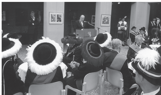
Ontvangst op het gemeentehuis

De wedstrijden hadden een vlot verloop ondanks de onderbreking tijdens een hevige regenbui. Ieder gilde kreeg een herinneringsschild en de prijzen werden verdeeld onder de winnaars.