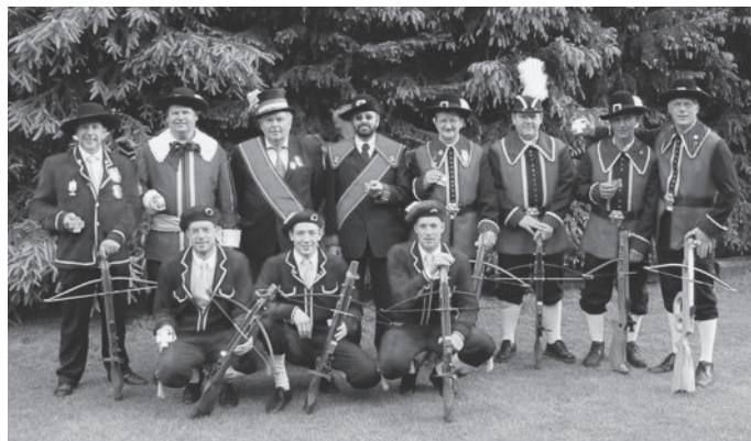
De winnaars van alle categorieën