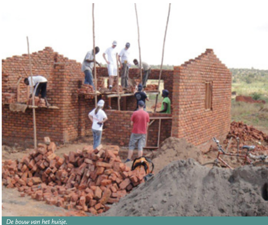
De bouw van het huisje.

Zondag komen we aan op het vliegveld van Lilongwe. Wat mij onmiddellijk opvalt is dat er twee uitgangen zijn: je kunt de officiële weg langs de douane nemen maar je kunt ook langs het gebouw lopen en dan sta je buiten aan de weg bij het parkeerterrein. Inklaren gaat uiterst correct en vriendelijk. De bus van Habitat staat samen met Martin op ons te wachten. De eerste kennismaking met de plaatselijke bevolking en het land zijn bijzonder prettig. Tijdens de reis naar de lodge komen we een politiecontrole tegen. Ook hier weer een correcte behandeling. Het landschap maakt een droge indruk: een steppe met rood zand met hier en daar bewoning.