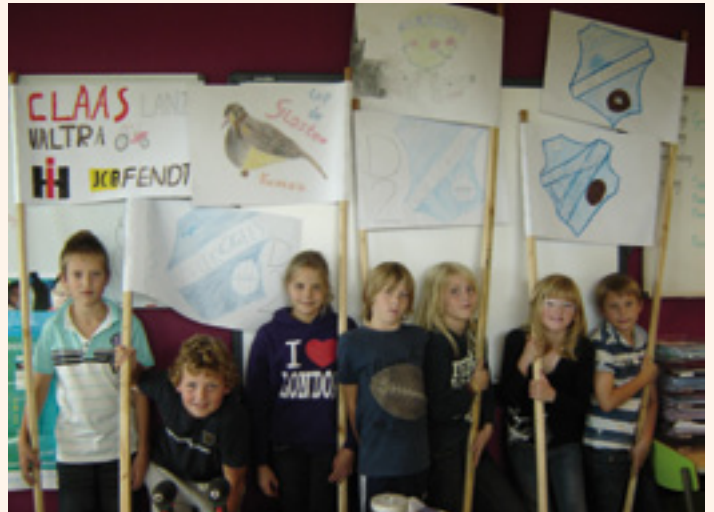
de deelnemers aan de workshop

Een paar leden uit de overheid van ons gilde hebben in een gesprek met de directeur van basisschool Prinses Wilhelmina uitleg gegeven over het schuttersgilde. Als snel kwam de vraag of wij bereid waren deel te nemen aan een workshop en zo geschiedde. In oktober hebben we op drie vrijdagmiddagen gewerkt met zeven leerlingen van groep 7. We begonnen met het vertonen van de DVD "Doar hedde de guld", en hebben uitleg gegeven over ons vaandel en vlaggen. De leerlingen kregen opdracht zelf een vlag te ontwerpen. Op de vierde vrijdag was er open podium en werden alle workshops gepresenteerd. Schuttersgilde Sint Martinus en Sint Antonius van Lexmond en Hei- en Boeicop en de zeven leerlingen mochten de middag openen. Vanaf de bovenverdieping werd met trom en vlaggen voorop, de zeven leerlingen met hun gemaakte vlaggen erachteraan, de trap afgegaan om zich te presenteren in de grote hal van de school. De leerlingen moesten aan de aanwezige ouders vertellen wie wij waren, wat zij hadden gemaakt en uitleg geven over hun gemaakte vlag. Een geslaagde workshop die in januari 2012 vervolgd zal worden. ■