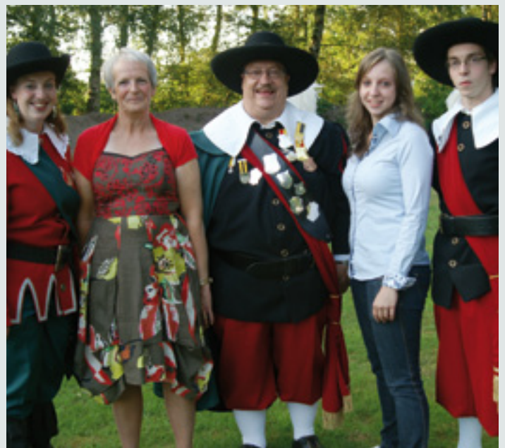
Een "schoon" familiefoto.