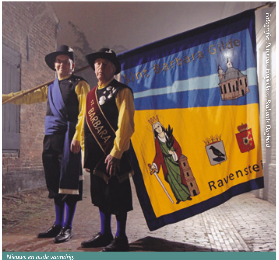
Nieuwe en oude vaandrig.