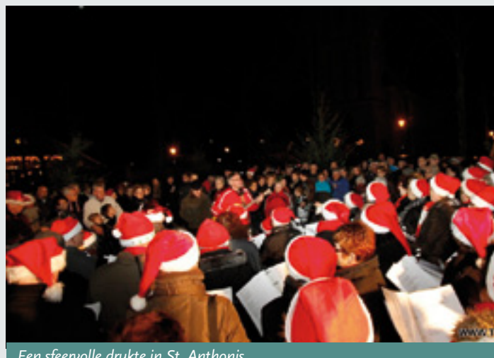
Een sfeervolle drukte in St. Anthonis.