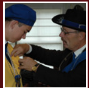
laserschietsen op wip