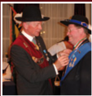
Oude rotten nemen afscheid