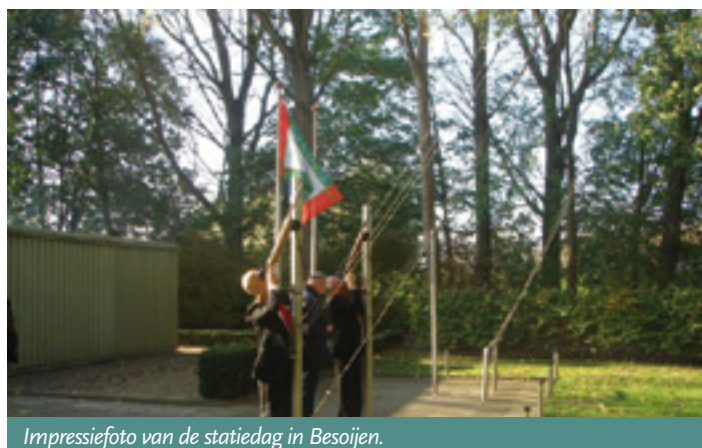
Impressiefoto van de statiedag in Besoijen.

Op maandag 31 oktober 2011 werd bij het gilde Sint Crispinus en Sint Crispinianus van Besoijen weer de jaarlijkse statiedag gehouden. Vanuit de gildekamer trok het gilde naar de Sint Janskerk om de dag te openen met een mis. Daarna werd de onlangs in Waalwijk benoemde pastoor Dorssers geïnstalleerd als nieuwe gildeheer en werd hem de vendelgroet gebracht. Aansluitend vertrok het gilde naar het raadhuis waar de burgemeester al klaar stond om 'zijn' vendelgroet in ontvangst te nemen. Zoals de traditie voorschrijft werd het gilde vervolgens door de burgemeester uitgenodigd om in de oude raadzaal van Waalwijk koffie met worstenbrood te nuttigen. Ook de nieuwe gildeheer was hierbij aanwezig. Toen vertrok het gilde naar de gildekamer voor een lunch. In de middag werd er geschoten voor de jaar- en dagprijzen die tijdens de feestavond in het gildepaviljoen werden uitgereikt, waarmee weer een mooie statiedag werd afgesloten. ■