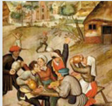
Fragment schilderij P. Breughel de Oude