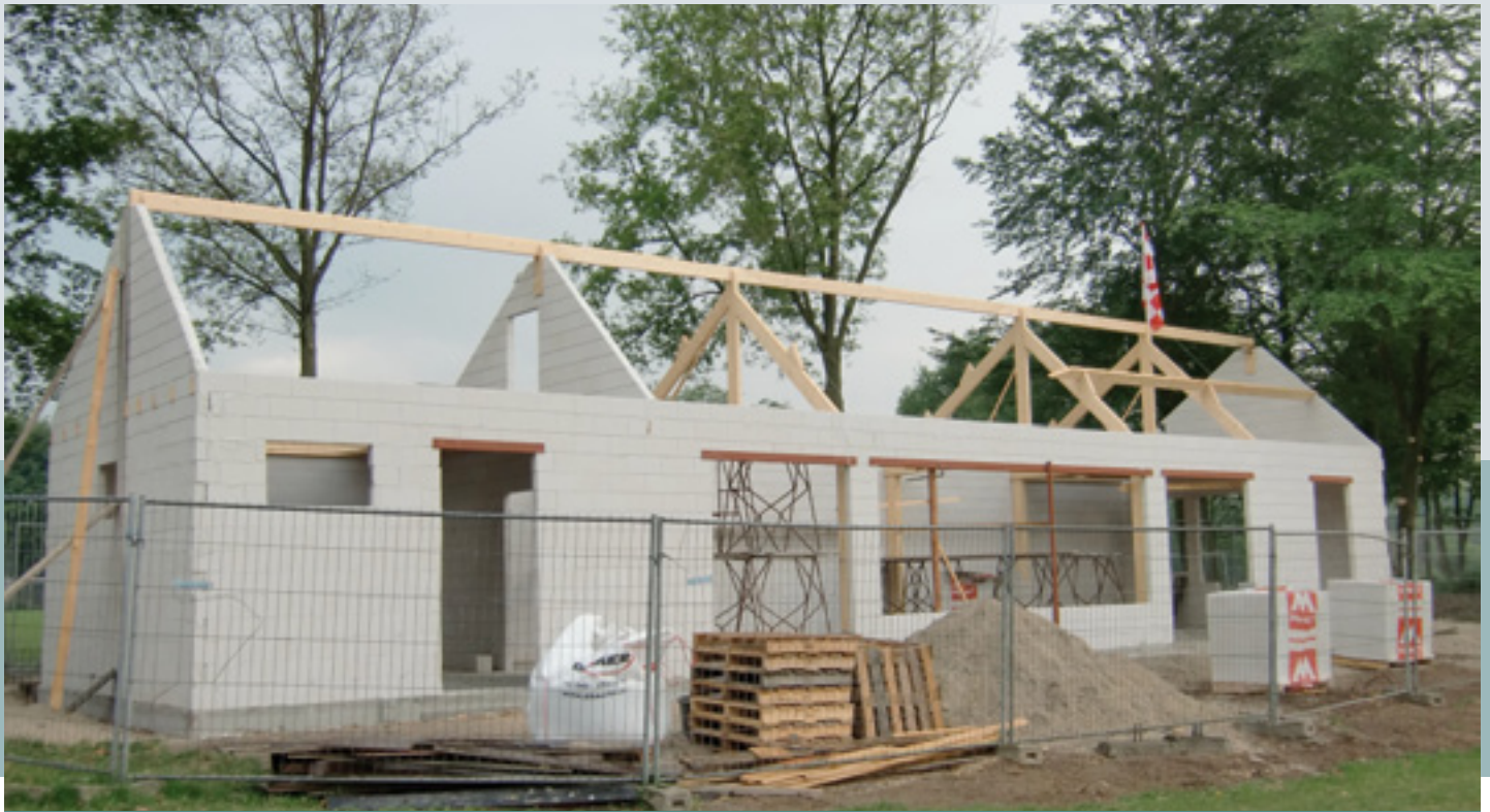
De ruwbouw van het nieuwe gildehuis, eind december 2011.

ook dat er geen sprake is van een beperkte bebouwing.