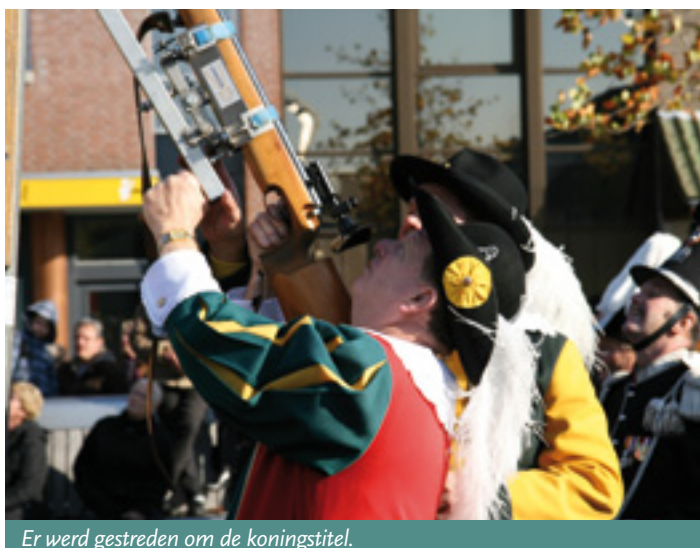
Er werd gestreden om de koningstitel.